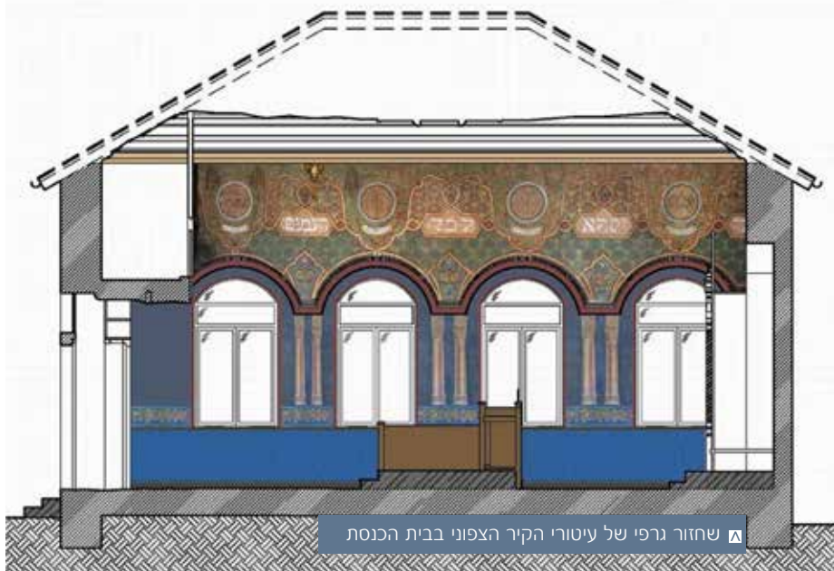
▲ שחזור גרפי של עיטורי הקיר הצפוני בבית הכנסת

זים | משרד ראש הממשלה, פרויקט ציוני דרך, עיריית ירושלים תכנון פרויקט השימור | ג'ק נגר תיעוד אדריכלי | אדר' רם שואף, אדר' יונתן צחור, ריצ'ל סינגר תיעוד היסטורי | ד"ר נירית שלד-כליפא ביצוע | ולדימיר ביטמן, אלכסיי רונקין, אולגה פינקלשטיין, שולי לבנבוים