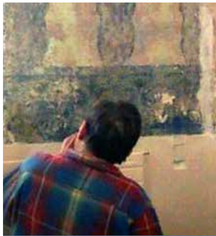
▲ שחזור גרפי של עיטורי הקיר הצפוני בבית הכנסת

אשר אבדו עם השנים בעקבות עבודות שיפוץ שונות בבניין.