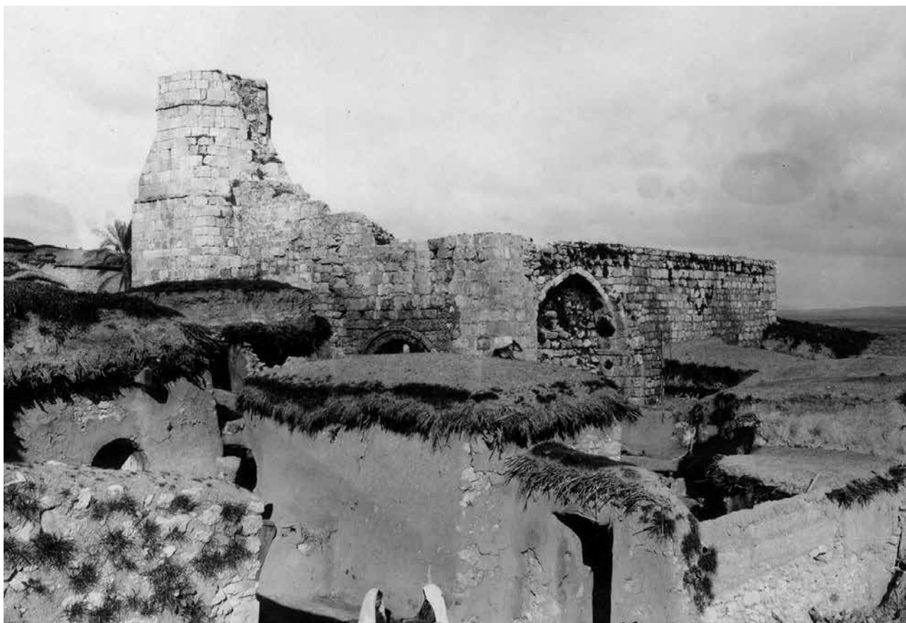
איור 2 | יבנה בסוף המאה ה־19 מסגד הכפר הבנוי אבן ברקע בקתות קש ובוץ. מקור: ארכיון רשות העתיקות, צילום: לא ידוע, שנה: לא ידוע