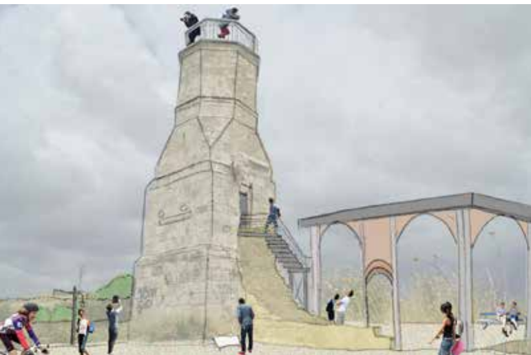
איור 10 | רחבת המסגד והמינארט כמוקד מרכזי בראש התל איור: אדר' יהונתן צחור, 2014

מקטע דרך D ואזור "יבנה המודרנית": מקטע הדרך האחרון נמשך מהמינארט עד ליציאה הדרומית למרגלות התל. כאמור לעיל, נושא מקטע רביעי זה הוא התחדשותה של יבנה ובנייתה של עיר מודרנית.