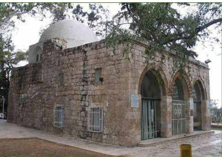
איור 4 | מאוזוליאום לציון קבר אבו־הוריירה ורבן גמליאל ממערב לתל יבנה | צילום: לא ידוע, 2014

איבלין הצלבנית. לאחר קרב קרני חיטין בשנת 1187, שבו הובס הצבא הצלבני, נפלו ערי הארץ בקלות יחסית לידי של השליט האיובי צאלח א־דין. העיר ירושלים עמדה במצור קצר (21 ימים) אך אינטנסיבי