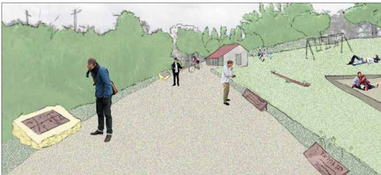
איור 7 | ציר זמן תלמודי בעלייה לראש התל | איור: אדר' יהונתן צחור, 2014

הצלבנית שהפכה למסגד. רחבת התצפית תשמש מוקד התכנסות לאחר העלייה לראש התל (מצפון). מנקודה זו יש תצפית לצפון, שמתאימה לציון סיפורה של ממלכת הצלבנים וחשיבותה של איבלין. רחבה זו ממוקמת סמוך לקטע קיר צפוני של המבצר, שהוא השריד הפיזי היחיד מתקופה זו בתל, ותאפשר גישה אליו והסבר עליו. רחבה גדולה זו תשמש קבוצות