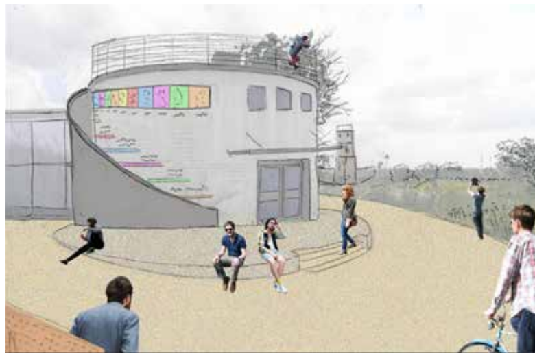
איור 9 | מרכז מולטימדיה חדשני במבנה בריכת הבטון העגולה איור: אדר' יהונתן צחור, 2014

מבנה בטון עגול, ששימש בריכת מים, אותו ייעדנו (לאחר שיפוצו והסבתו) לתפקד כמרכז מולטימדיה (איור 9), המנצל את מיקומו ואופיו העגול והאטום להקרנת סרטים שונים העוסקים בתל ובתכניו ולהקרנת הסרט "ממלכת גן עדן" העוסק בסיפור איבלין והאביר