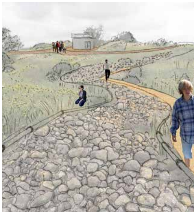
איור 11 | גן נושאי בין גלי האבנים בראש התל. איור: אדר' יהונתן צחור, 2014

במקטע זה מוקד הצללה טבעית - רחבת עצי האשל הגדולים בדרום התל. התכנית מציעה, כי מקום זה ישמש גן משחק, בתווך שבין אזור הפיתוח האינטנסיבי הדרומי, הנבנה כאמפי־פארק עירוני, למרכז התל.