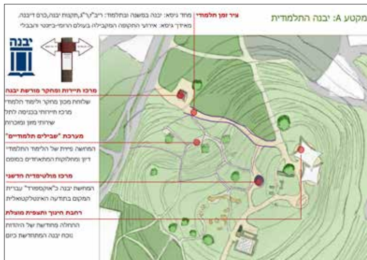
איור 6 | מקטע יבנה התלמודית | תכנון: אדר' יהונתן צחור, 2014

עות'מאנית ואילו המקטע הרביעי - מקטע D פונה מסיפורי העבר להווה ולעתיד של יבנה החדשה. מקטע־דרך A ואזור "יבנה התלמודית": (איור 6) תחילתו של קטע הדרך הראשון בכניסה הצפונית הראשית לתל, והוא נמשך ומגיע עד לראש התל מצפון.