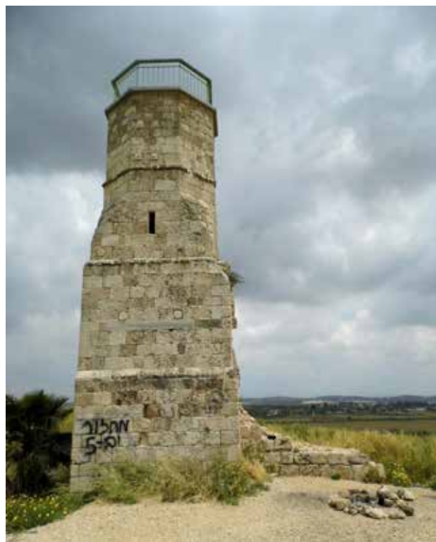
איור 3 | המינארט הממלוכי בראש התל לאחר שימורו ב־2010

מטרת התכנון הייתה לפתח את התל למוקד של ביקור ופעילות ולשלב במערך השטחים הפתוחים בעיר ובסביבתה, בין פארק נחל שורק ממזרח לפארק הסנהדרין ממערב ולשטחים פתוחים עירוניים נוספים. החזון התכנוני של השימור והפיתוח בתל ובסביבתו הוא חיזוק הזיקה בין התושבים והמבקרים לבין ערכי המקום. זאת באמצעות שילוב של פעילויות פנאי,