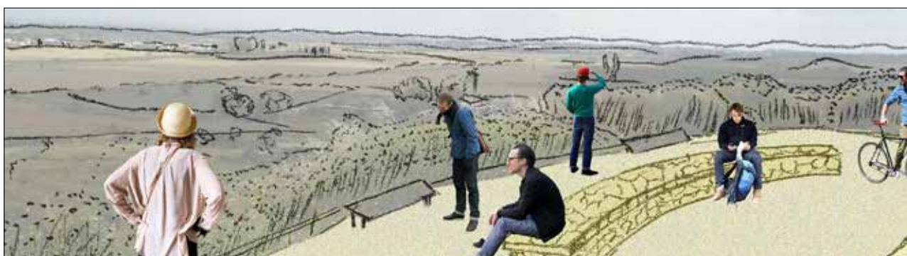
איור 8 | רחבת תצפית מערבה | איור: אדר' יהונתן צחור, 2014

שני מוקדים נוספים במקטע "יבנה תלמודית" משותפים גם למקטע הדרך הבא של "איבלין הצלבנית", והם: תצפית מוצלת ומרכז מולטימדיה חדשני. במוקדים אלה יעסקו בנושאים המופשטים