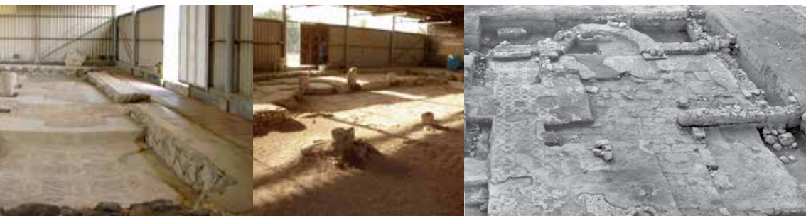
מימין: מראה בית הכנסת לקראת סוף החפירה, חיבור תמונות נפרדות מתיק החפירה, מבט לדרום במרכז: מראה אולם בית הכנסת מכוסה באבק ובעפר, בשנת 2006 משמאל: פרטים ברצפת הפסיפס

בסוף שנות ה־70 בוצעו באתר שימור ושחזור, ומעליו הוקם מבנה ברזל ואסבסט. הטיפול, אשר בוצע באמצעות שימוש רב בבטון, כמקובל בשעתו, בא לשחזר