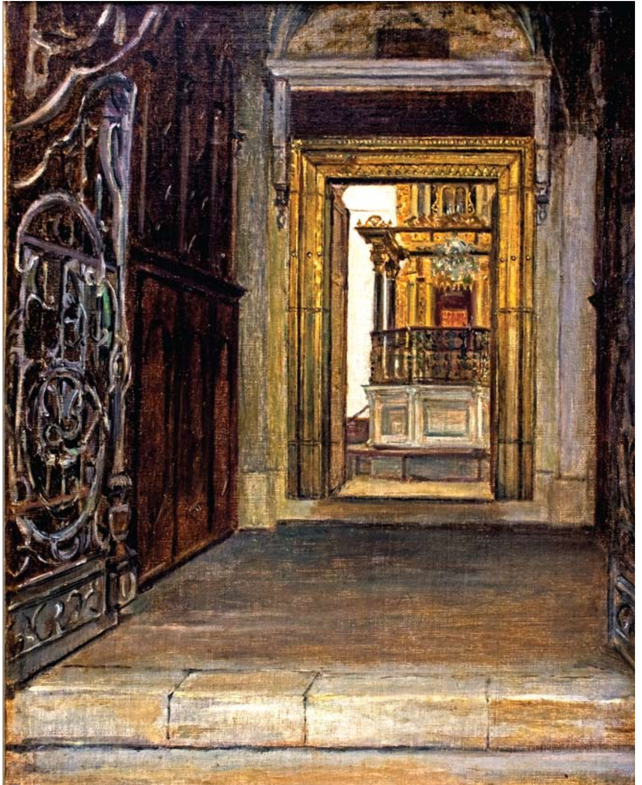
יצירת שמן של הצייר הדני אקסל הלסטד, תר"נ (1890). התמונה מוצגת לראשונה (אוסף משפחת סמסון; צילום: נ' דוידוב, 2008)