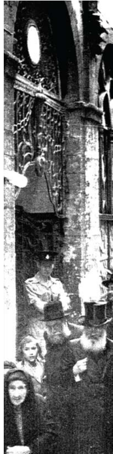
פרט מתצלום משנת תש"ד (1944) מימין: הרב יצחק הרצוג