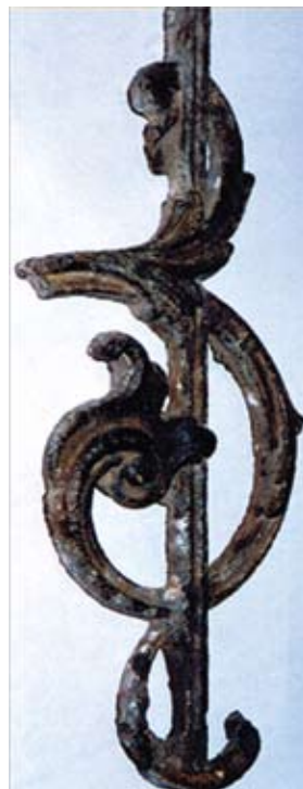
שריד משער הכניסה לבית הכנסת