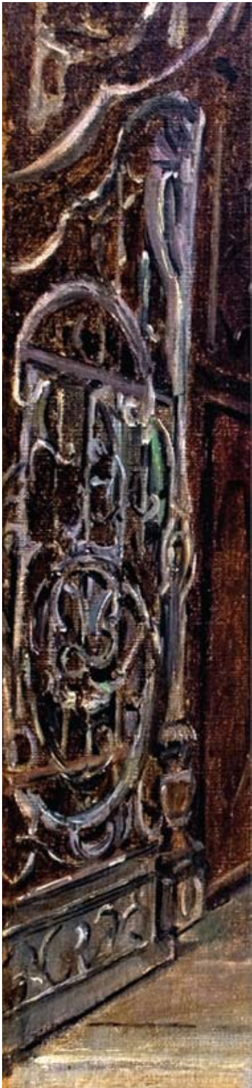
פרט מתמונת שמן של הצייר הדני אקסל הלסטד, תר"נ (1890)

ארון הקודש הובא "על ידי שליח מיוחד, השד"ר ר' חיים קובנר" (יערי, שלוחי ארץ ישראל, עמ' 804-803), הוא הביא גם תרומה חשובה לבניין מר' פנחס חזנברג, חיט בחצר הצאר בפיטרסבורג, והוא שהביא גם את דלתות שער הכניסה, גם הן מעשה ידי אמן