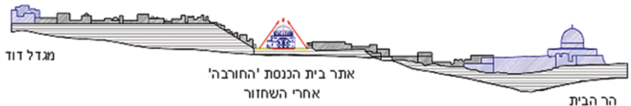
חלקה הדרומי של ירושלים העתיקה חתך טיפוסי בציר דרום-מערב-מזרח לאחר שחזור בית הכנסת החורבה

לאחר הפצצתו עמד מבנה 'החורבה' הרוס עד תחילת עבודות השחזור של בית הכנסת בתשס"ב (2002), אך הוא עבר שימור חלקי. בתקופת שיקום הרובע היהודי נבנתה מעל שרידי המבנה קשת בלתי מדויקת בצורתה ובסגנונה, שהטעתה אלפי מבקרים. כיכרות ורחובות חדשים שנבנו סביב חורבות בית הכנסת יצרו מציאות אורבנית חדשה שאינה מתאימה לבנייה בעיר ההיסטורית. אתר בית הכנסת בחורבנו, כשסביבו הכיכרות החדשות, היה מעין 'חור אורבני' וטעות תכנונית שהייתה מצב גאו-פיתולוגי בעיר. זאת ועוד, במשך שישים שנה בקירוב 'סבל' קו הרקיע של ירושלים העתיקה מחסר בנקודת ציון רבת חשיבות מבחינה אורבנית ונופית ולא היה ברובע מבנה מונומנטלי המשמש מרכז אורבני ותרבותי. הקמת המבנה החשוב מחדש תחזיר לרקמה העירונית את המפתח התכנוני האופייני לירושלים ותדגיש את הטופוגרפיה שלה. יתרה מזאת, במקום חורבה והקשת הבלתי מדויקת של שנות השבעים ישוב קו הרקיע של העיר ויקבל, על רקע השמיים, את הקשת הנכונה - כיפה רחבת ידיים של בית הכנסת. בהיבט הלאומי שחזור 'החורבה' מסמל את תקופת התקומה של ירושלים העתיקה.