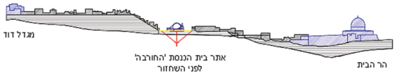
חלקה הדרומי של ירושלים העתיקה חתך טיפוסי בציר דרום-מערב-מזרח לפני שחזור בית הכנסת החורבה