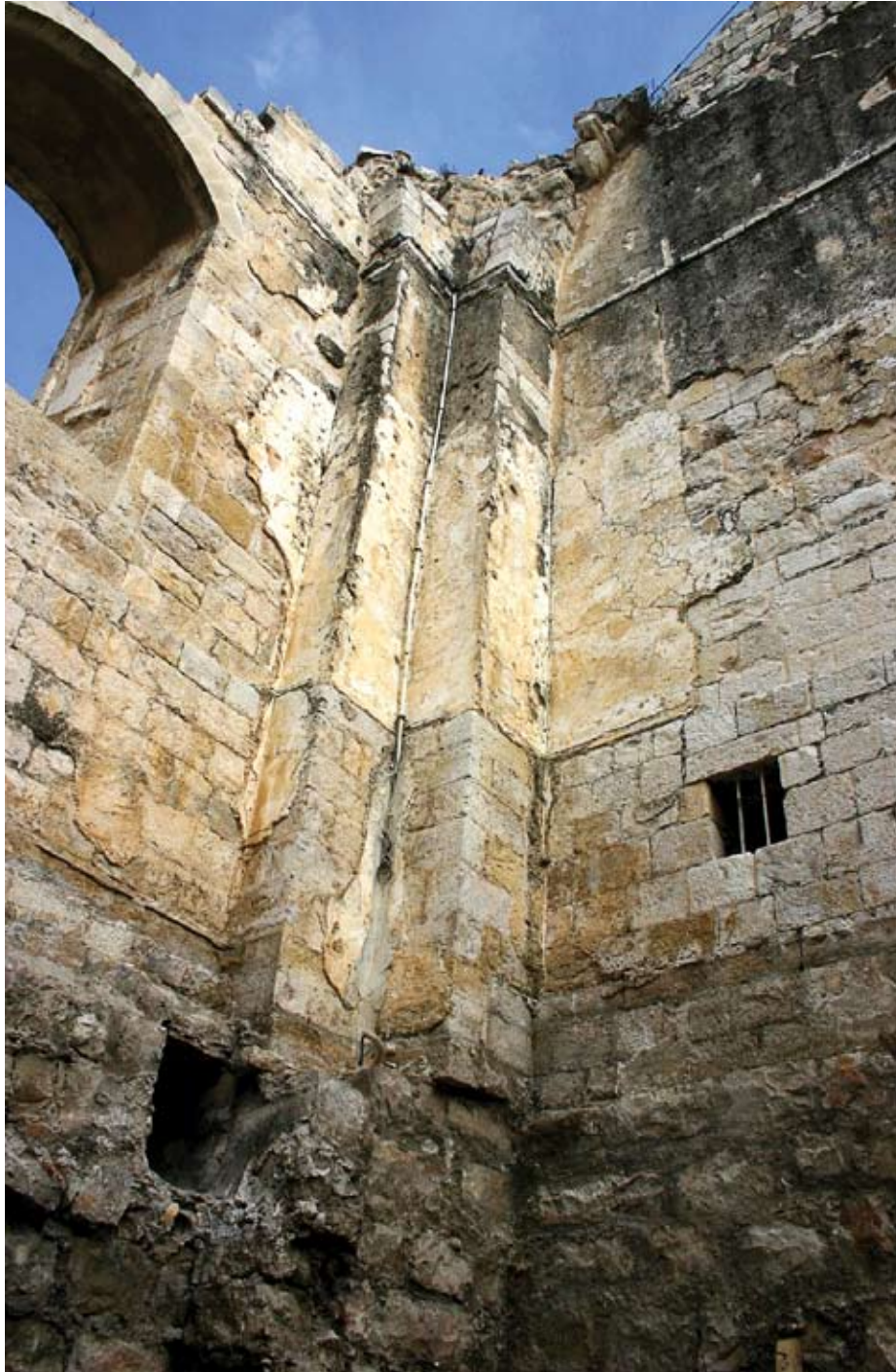
שרידי טיח וסטוקו מקורים באומנה הצפון מזרחית של בית הכנסת, צילום: פאינה מילשטיין, 2006