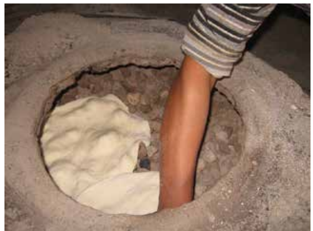
איור 7 | הדגמת השימוש בטאבון. סדנא לבניית טאבון, סוסיא

שימוש במלאכות המסורתיות להפקת רווח כלכלי, ומתוך כך - שימורן. במקרה זה, המלאכות נעשות למטרות מסחר או תירות. גישה זו מיושמת במקומות רבים בעולם, ובמקרים מסוימים גם בארץ, ברמות שונות של התפשרות על אותנטיות. אף שלא הגדרנו אמות מידה לאותנטיות, ברור שהעיסוק במלאכות למטרות מסחר מכפיף אותן מראש לדרישות השוק, ומסיר מהן גם את המשמעות החברתית והתרבותית המקורית, וגם את האיכות המסורתית, המבוססת בעיצוב, בצבע, בסמליות ועוד. בתנאים אלה קשה מאד לשמור על אותנטיות של המוצר, אף על פי שקיימת אפשרות סבירה לשימור אופן העבודה המסורתית. כלומר, גם אם המוצר שנעשה מאבד את איכותיו המסורתיות מבחינות רבות, הרי שהשיטה שבה הוא מיוצר דומה לשיטה שנוצרו בה המוצרים המסורתיים. קביעה זו איננה נכונה בכל מקרה, וכן מעלה את השאלה האם די ב"דמיון חלקי באופן הייצור" כדי להיחשב שימור המלאכה. אחת הבעיות של גישה זו היא העובדה שרמת המיומנות הנדרשת היום לצורך ייצור חפצים שמטרתם היחידה היא מכירה לתיירים איננה גבוהה, ובדרך כלל המלאכה לא תבוצע ברמה המיטבית שלה. כמו כן, אם המטרה היא מכירת מוצר והפקת רווח, הרי שההתפשרות על אופן הייצור תהייה בלתי נמנעת, והפיתוי לעבור לאמצעי ייצור מודרניים או מודרניים למחצה, המחקים את אופן הייצור המסורתי, יהיה גדול מכדי להמשיך ולקיים את הייצור המסורתי. במקרים יוצאי דופן תיתכן דווקא הקפדה על ייצור מסורתי, ברמת גימור ואיכות ללא פשרות, גם אם האיכות איננה נמדדת במונחים המסורתיים אלא במושגי השוק לגבי איכות העבודה, לשם מיתוג ושיווק לקונים אקסקלוסיביים. ברוב המקרים הללו אין מחירי