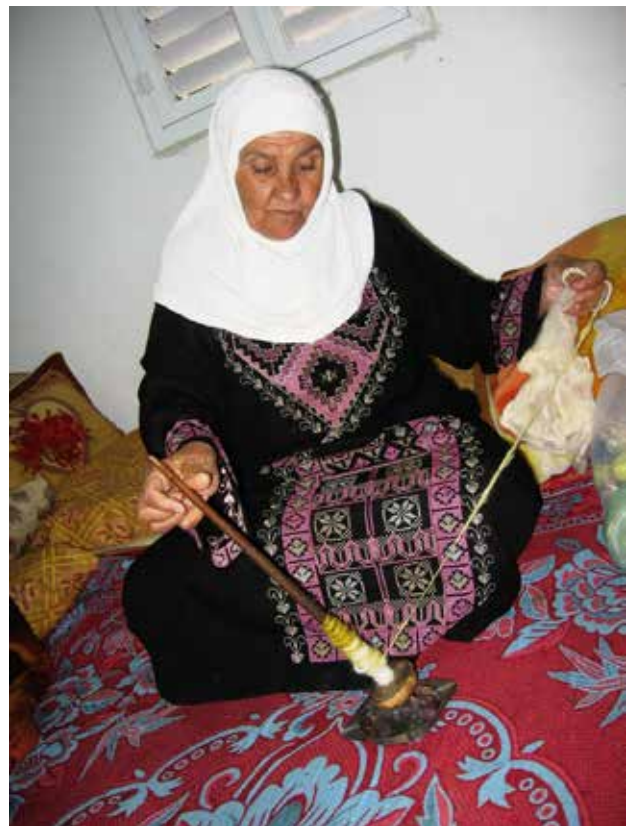
איור 1 | טווייה בפלך תמוך. כפר מצר, גליל תחתון, בדואית משבט חמדון

המסורתיים, אך מאמצת אל תוכה חומרים חדשים, או השפעות אחרות המתבטאות בהתאמה לתנאים החדשים שנוצרו. העדויות החיות הקיימות היום למלאכות רבות שייכות כבר לשלב המעבר הזה, מעצם העובדה שמדובר על אנשים שנולדו במאה העשרים. בבואנו לשמר מלאכה או מסורת ייצור - לאיזו נקודה בזמן עלינו להתייחס? האם ניתן לנסות ולהתייחס למה שקדם לידיע החי הקיים רק על סמך עדויות מן העבר? מהי מלאכה מסורתית אותנטית? למשל -