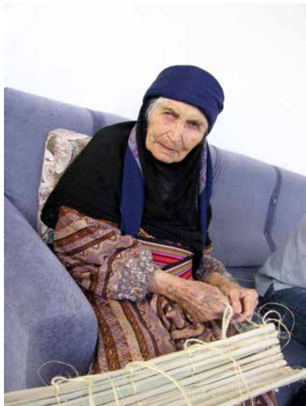
איור 3 | בדואית מערביי החולה מחזיקה מחצלת שאותה לימדה אותי לארוג. בתי הכפר שגדלה בו היו עשויים ממחצלות כאלה

צפון הארץ), קליעת סלים בשיטות שונות - פלאחים ופלאחיות (אזור רמאללה - קליעה בזיתים, אזור שכם - קליעה בקנה, צפון הארץ - קליעה בקש חיטה), קליעה של מקלעות חיטה (דרוזיות, צפון הארץ), אריגה בנול קרקע (בדואיות - נגב, פלאחיות - דרום הר חברון) אריגת אצבעות (בדואים - צפון הארץ), עיבוד עורות ליצירת נאד מים או מחבצה (בדואיות - גליל, נגב, בקעת הירדן, פלאחיות - דרום הר חברון).