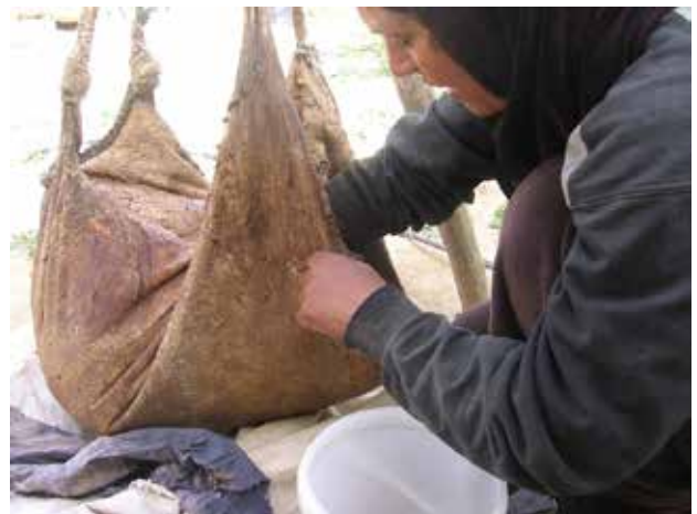
איור 8 | סדנא להכנת מוצרי חלב מסורתיים בסוסיא. הוצאת הזבדה (סוג חמאה) לאחר החביצה במחבצה מסורתית מעור טז

מהקשיים הכרוכים בשימור המלאכות, והעלו שאלות נוספות רבות בדבר הדרכים שבהן אפשר להתייחס לשאלה כיצד לשמר מלאכות.