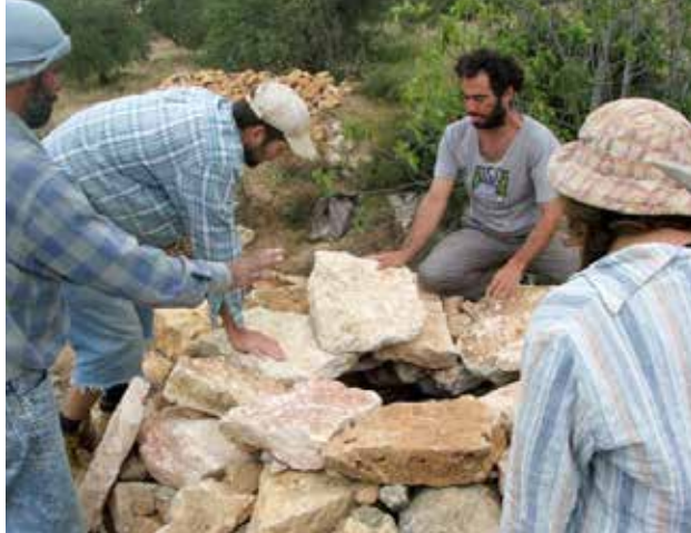
איור 4-6 | סדנא לבניית שומרה בבנייה יבשה. אזור ירושלים. בהדרכת בנאי וסתת אבן מבית ג'אלה