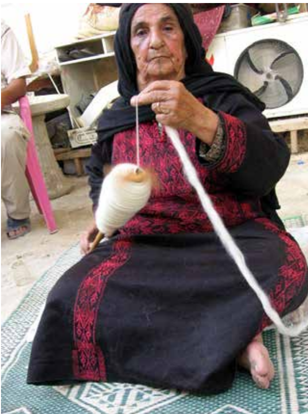
איור 2 | טווייה בפלך עם משקולת עליונה. עוג'א, בקעת הירדן, בדואית משבט עטיאת

באופן המובהק ביותר את המורשת התרבותית של כל עדה, ומי מחליט על כך? לדוגמה: הפלך ששימש את הנשים הבדואיות לטווייה בדרום הארץ לא היה דומה לפלך ששימש חלק מהנשים הבדואיות בצפון. ידועים לי לפחות שלשה סוגים שונים של פלכים שהיו בשימוש, ואופן העבודה בכל אחד מהם אחר לגמרי. ייתכן שהיו פלכים נוספים בשימוש שאין לנו מידע עליהם. התייחסות כוללת אל הפלך הנפוץ יותר כ"פלך הבדואי" היא האחדה המוחקת את המגוון מהתודעה. (איור 1, 2)