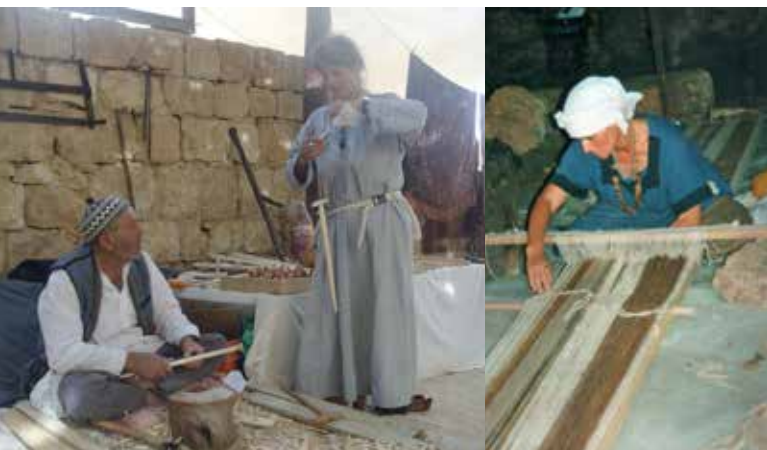
איור 10-11 | הדגמה של מלאכות באירועים המתקיימים באתרים ארכאולוגיים למטרות תיירות

החייאה והמחשה מוצגות בהם מלאכות מסורתיות. בעלי ובעלות מלאכה משחזרים את אופני העבודה המסורתיים עבור התיירים. הפעילות יכולה לכלול גם מלאכות שלא קשורות בייצור חפצים לממכר. גם כאן הדילמה המרכזית קשורה למידת הכדאיות הכלכלית, לעומת ההקפדה על שיטות ייצור מסורתיות. ברחבי העולם קיימים כפרים משוחזרים או פסטיבלים מקומיים, ובהם גם הדגמה של מלאכות מסורתיות ברמה גבוהה. בארץ לא קיים אף אתר המקיים פעילות כזו ברמה שאפשר לקרוא לה שימור אמיתי של תהליכי ייצור מסורתיים. האתרים שבהם נעשה ניסיון כזה סובלים בדרך כלל מעיוות חמור של המציאות ההיסטורית, מרמה גבוהה של מסחור ומרמת דיוק נמוכה. הפוטנציאל הטמון ברעיון זה הוא גדול, כיוון שהדגמת מלאכות בהקשר של אתר היסטורי יכולה להעשיר מאד את החוויה של המבקרים ואת הבנת רוח המקום. זאת, בתנאי שיש הקפדה על אמינות היסטורית. לשם שימור הידע, הפעילות במקום תכלול גם הוראה והכשרה של תלמידים ותלמידות ממשיכי דרך. (איור 10, 11)