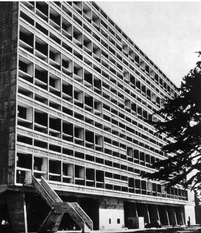
איור 3. "יחידת המגורים מרסיי" 1947-1952, חזית מערבית (Domus 312, November 1955)

והכלכליים החדשים. אחת הדוגמאות המובהקות היא הצעתו לראות את בניין המגורים כ"מכונה":