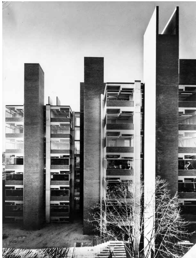
איור 2 | בניין "מעבדות ריצ'ארדס"

עקרון "יחידת המגורים" יושם בחמישה מבנים בערים שונות (Marseille, Cité Radieuse 1947-1952, Nantes-), Rezé 1955, Berlin-Westend 1957, Briey 1963, Firminy 1965), כאשר הראשון והמפורסם בהם הוא "יחידת המגורים מרסיי" (איור 3). מבנים אלה הפכו מאוחר יותר לאב טיפוס לצורת הבנייה אשר שינתה באופן דרמטי את הנוף האורבני המודרני - ה"שיכונים". דוגמה אחרונה לאינטרפרטציה של פרשנות