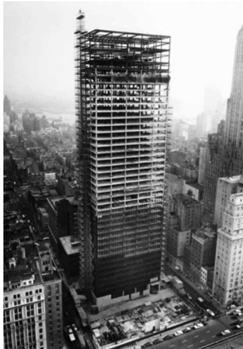
איור 4. בניין המשרדים "סגראם", ניו יורק, 1956, מבט לדרום

ה"פונקציה" שמולידה צורה ארכיטקטונית מצטיירת, לאור הסקירה, כמילה נרדפת ל"קונספציה אדריכלית". ייעוד המבנה אכן יכול לשרת את האדריכל כאחת מנקודות המוצא של פיתוח הקונספציה העיצובית, אך הוא בהחלט אינו היחיד בתהליך. בהתאם לכך, מבנה מודרניסטי הוא קודם כל אובייקט בעל ערך סימבולי עצמאי. מעמדו כיצירת אמנות המבטאת חקירה קונספטואלית קודם לתכליתו השימושית ובמקרים מסוימים הוא אף אינו תלוי בשימוש כלל. בניין מודרניסטי הוא אפוא קודם כל "הצהרה", ביטוי עמדה של אדריכלי המודרנה בדבר עקרון תכנוני חדש - "פונקציונליזם".